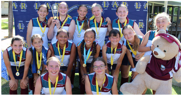
Die O/13A-hokkiedogters straal ná hul Kobus Wiese Super Series-oorwinning.