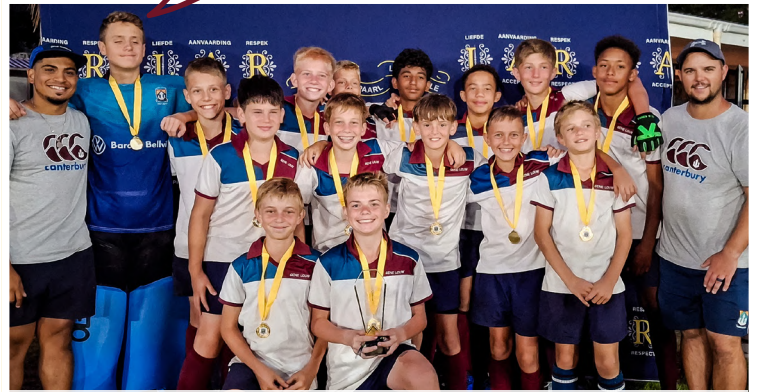
Die o/13A-hokkieseuns het alles uitgehaal om óók 'n stel medaljes te verower.